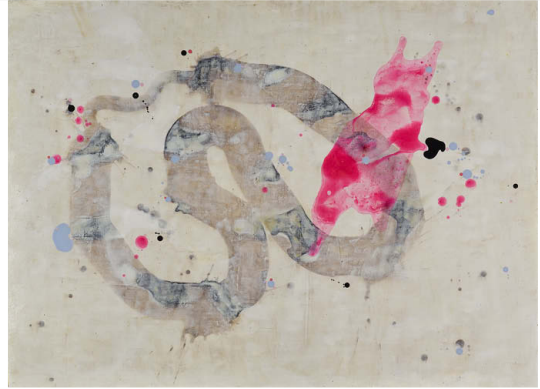
'Parst', 76 x 56 cm, 2008.

1969 In Frankreich geboren. Lebt in Berlin und Hamilton, NJ USA.